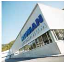
Neuman Fließpresswerk, Markt/Osterreich

Die Qualitätssicherung und zahlreiche Montageprozesse sind automatisiert. Die Verpackung und Vorbereitung für den Versand erfolgt unter Anwendung modernster technischer Hilfsmittel.