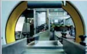
Prüfung in der Linie